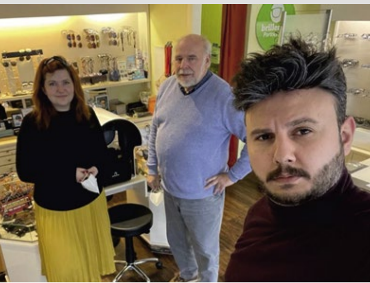
Das Team von OPTIK KAISER freut sich auf Sie!